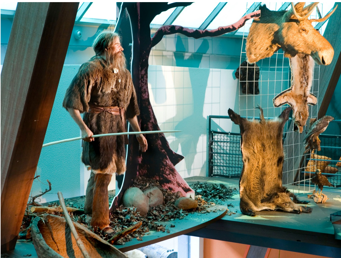
Jager uit Swifterbant-tentoonstelling in Nieuw Land

Nu schrapt u samen alles wat er in de Steentijd nog niet was: glas, plastic en metaal. Wat blijft er over? Begrijpen de leerlingen nu hoe moeilijk het is iets van de jagers-verzamelaars terug te vinden?