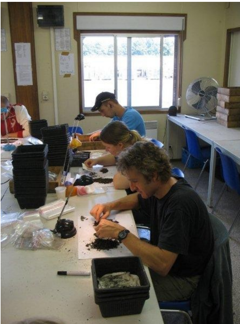
De leerlingen gaan aan het werk als echte archeologen in de dop.

De zes verwerkingsopdrachten kunnen gebruikt worden na een bezoek aan de opgraving of het museum, maar zijn zeker ook geschikt om te gebruiken op andere momenten.