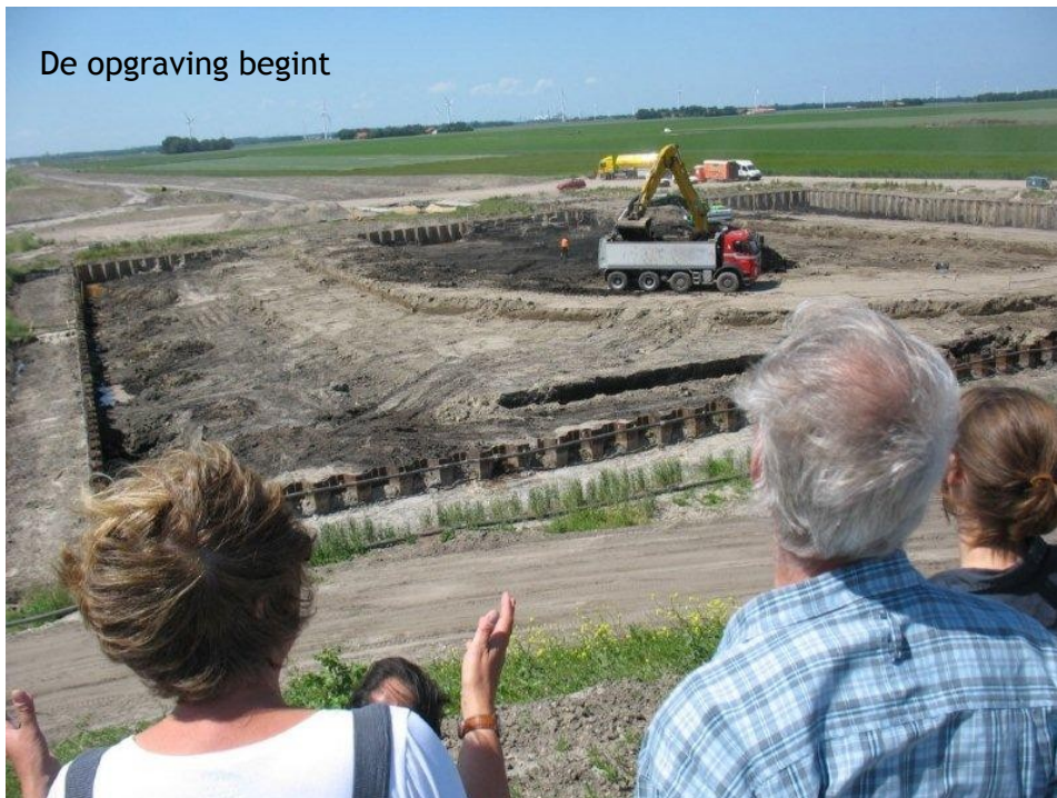
De opgraving begint

Begin juni 2010 zijn archeologen aan de Bisonweg bij Swifterbant (gemeente Dron-ten) begonnen met een bijzondere opgraving. Ter hoogte van de toekomstige op- en afritten van de N23 ligt een oude duintop, zo'n 3 m onder het maaiveld. Op deze duintop hebben ongeveer 7000 v. Chr. (de tijd van de jagers en verzamelaars) mensen gekampeerd, vuurtje gestookt, vuurstenen werktuigen gemaakt en hazelnoten gegeten. Het onderzoek op deze locatie zal tot 1 november 2010 duren.