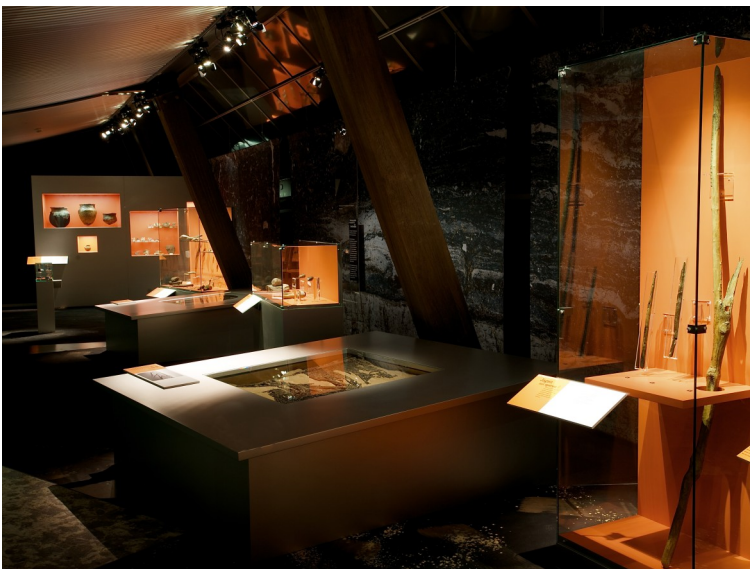
Impressie van de tentoonstelling 'Oer!' in Nieuw Land.

Misschien wordt de tentoonstelling mooi genoeg om andere groepen of de ouders voor de opening uit te nodigen. Extra: als ouders of andere groepen komen kijken zullen de leerlingen ze moeten rondleiden! Laat ze met elkaar afspreken wat leuk is - en ook wat je juist niet moet doen - bij een rondleiding van 10 minuten.